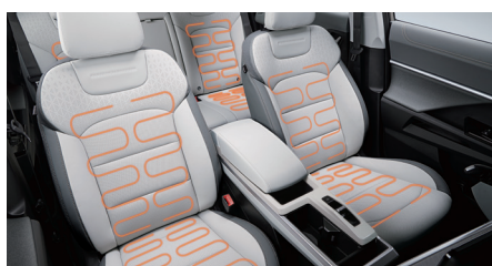
Verwarmde zetels voor- en achteraan