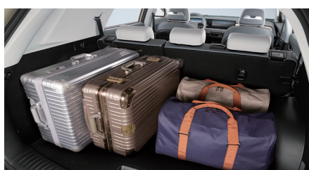
703 liter laadvolume