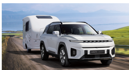
1.500 kg geremd sleepvermogen