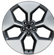
Lichtmetalen diamond cut velgen van 20"