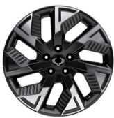
Lichtmetalen diamond cut velgen van 18"