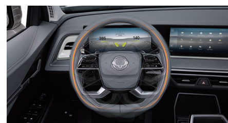
Met leder bekleed en verwarmd stuurwiel