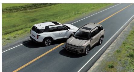
Multi Collision Brake (MCB)