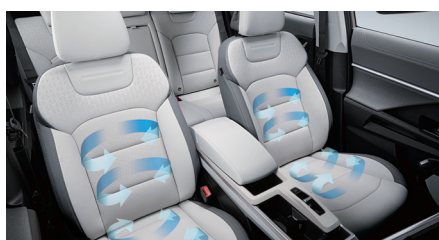
Geventileerde zetels voraan